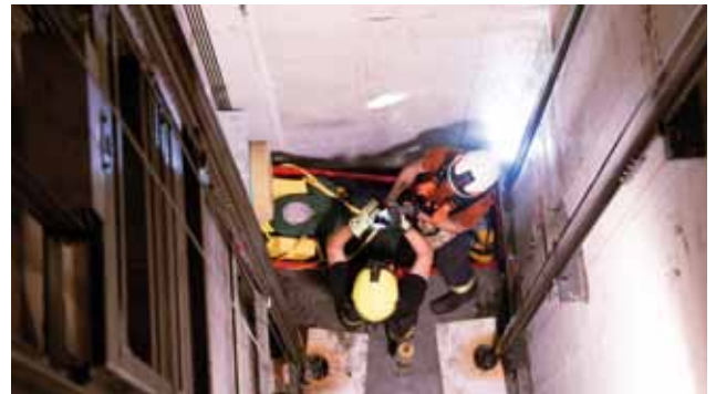
Personenrettung im Lift