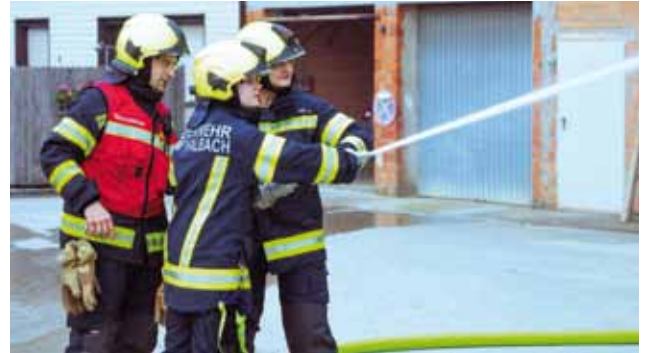
Brand landwirtschaftliches Gebäude