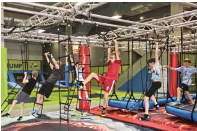
Ausflug und Nacht im FF Haus der Jugend